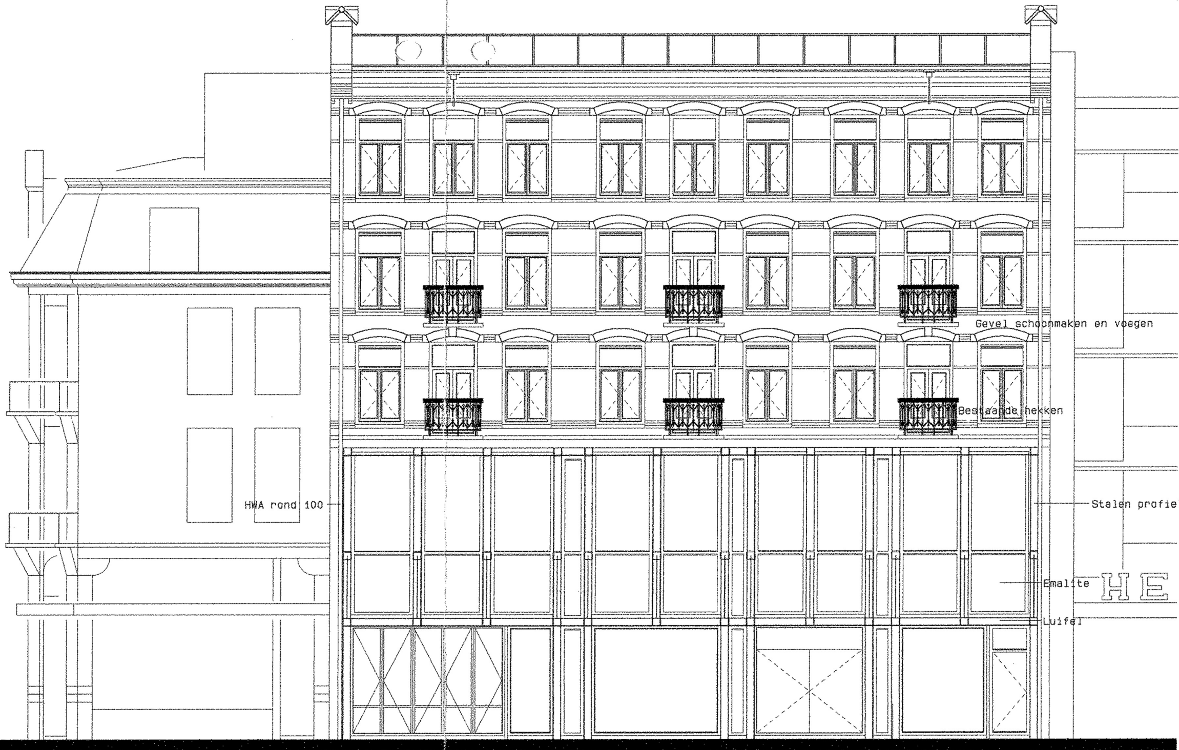
GEVEL FERDINAND BOLSTRAAT