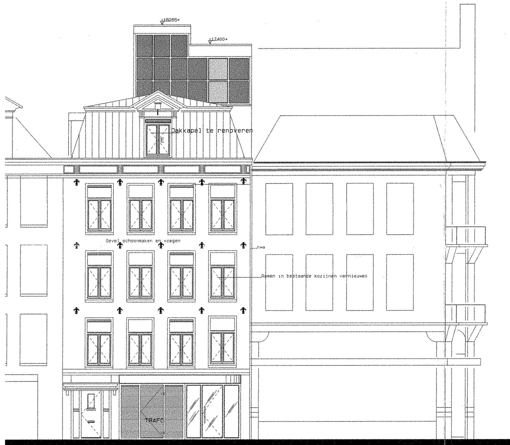
GEVEL EERSTE JAN STEENSTRAAT